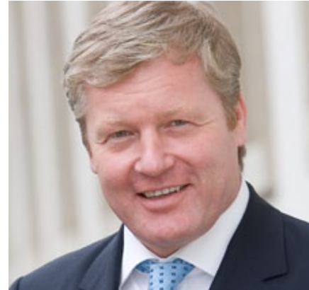
Dr. Bernd Althusmann Niedersächsischer Kultusminister

Liebe Eltern, liebe Schülerinnen und Schüler!